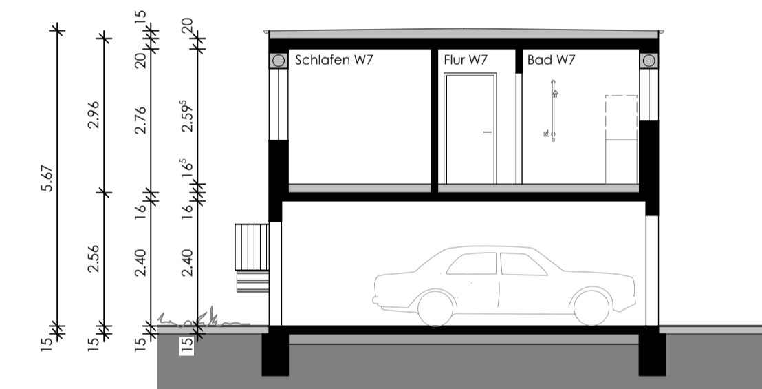
SCHNITT C - C