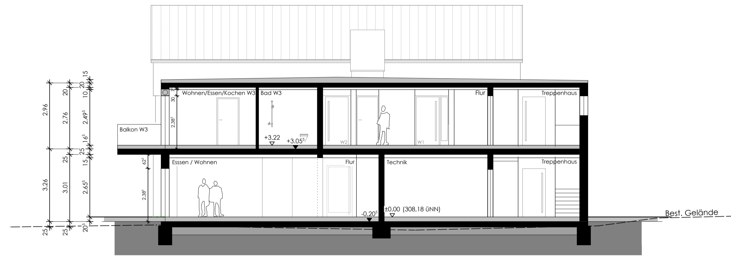
SCHNITT B - B